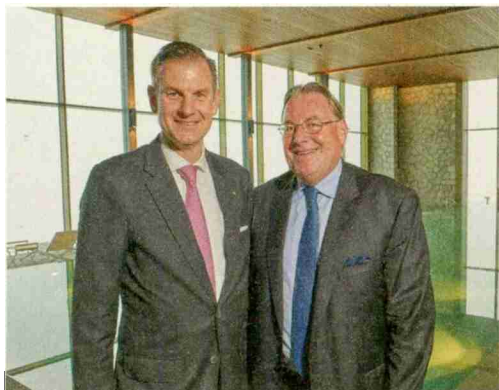
Visionär: Hoteliers Schöpfer, Herr.