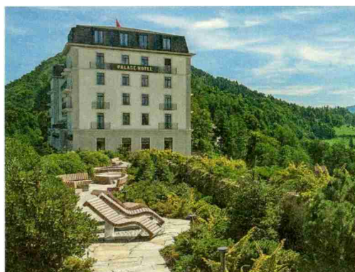
Platz für 2000 Gäste: das «Bürgenstock Resort».